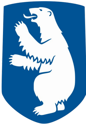
Armoiries du Groenland

L' histoire du Groenland est celle de la survie et de l'adaptation des hommes dans les conditions climatiques extrêmes de l' Arctique . La couverture de glace recouvrant environ 95 % du territoire, l'activité humaine est cantonnée aux seules régions côtières. Les peuples inuits vivant actuellement au Groenland ne s'y sont établis qu'au début du XIIIe siècle .